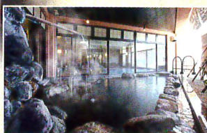
◆露天風呂(うたせ湯)

泉質:単純温泉(低張性・弱アルカリ性・高温泉) 効能:神経痛・筋肉痛・うちみ・慢性消化器病 痔疾・冷え性疲労回復・健康増進