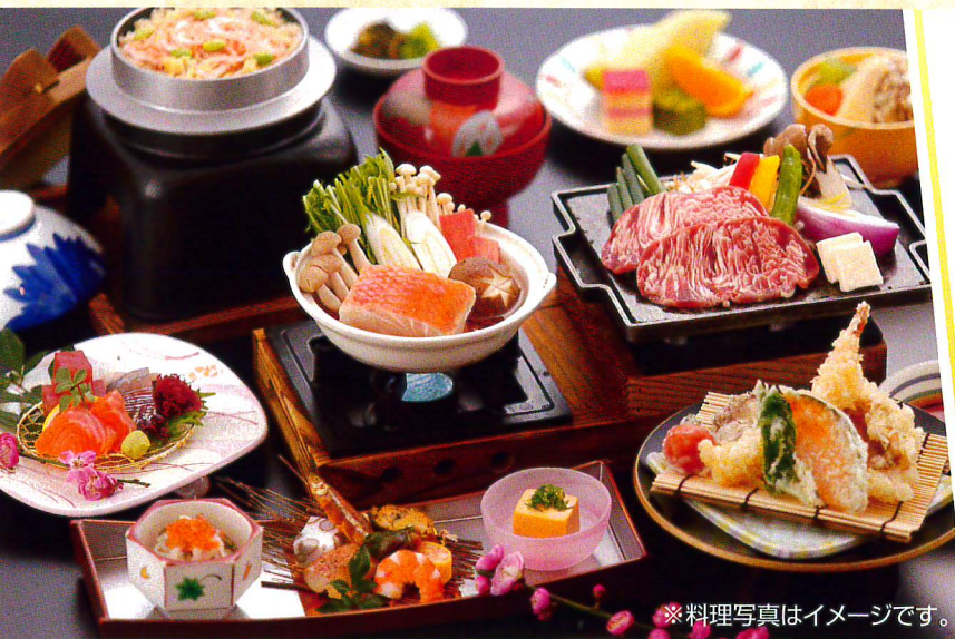
※料理写真はイメージです。