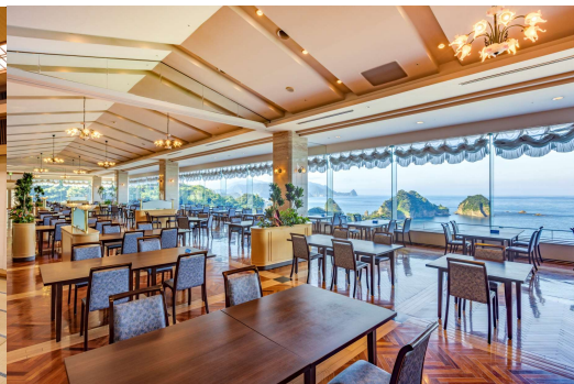
朝食会場 (和洋食バイキング)