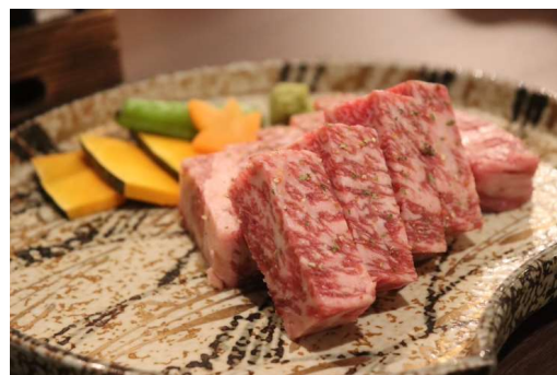
あしたか牛陶板焼