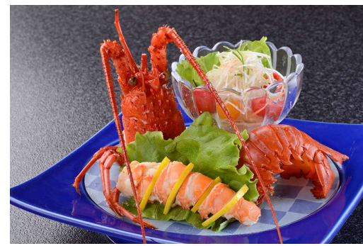
伊勢海老のサラダ