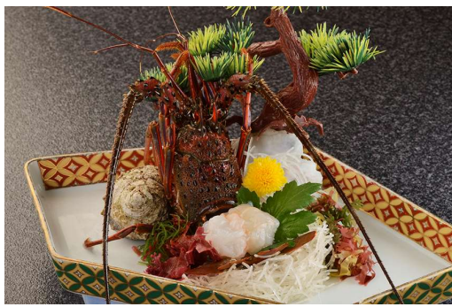
伊勢海老のお造り