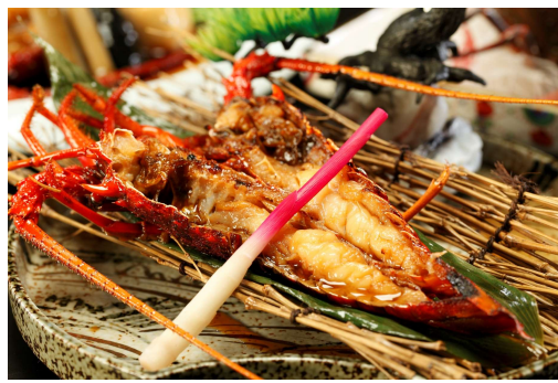
伊勢海老の鬼殻焼き