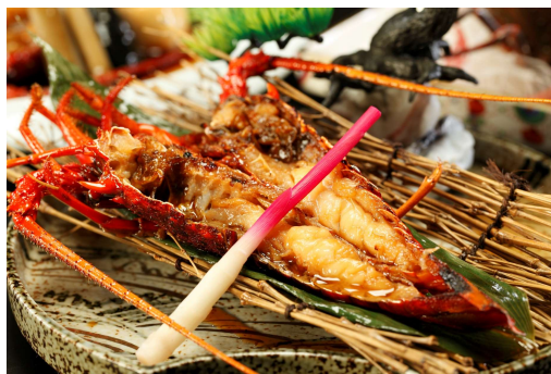
伊勢海老の鬼殻焼き