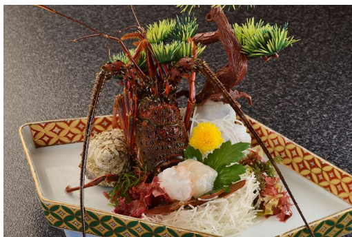
伊勢海老のお造り