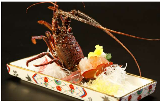
伊勢海老のお造り 時価