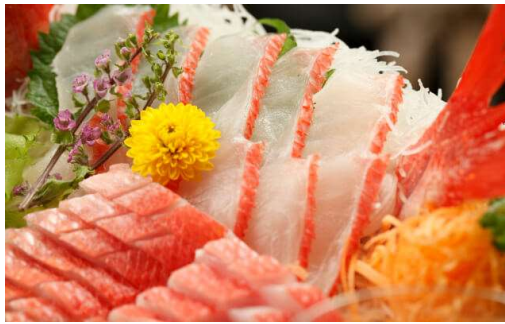
金目鯛の姿造り 9,500円