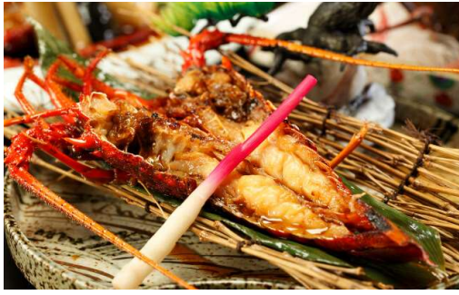
伊勢海老の鬼殻焼き 時価