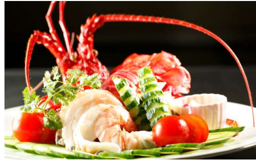
伊勢海老のサラダ 時価