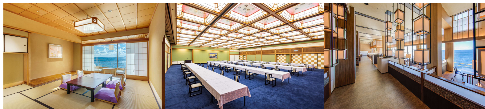
スタンダード和室