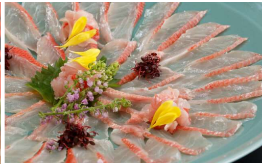
金目鯛薄造り (1尾) 9,500円